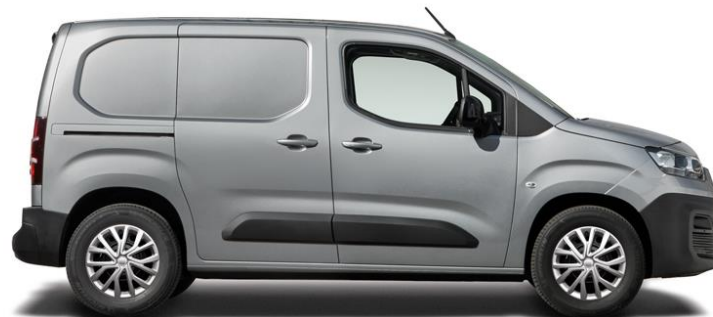
SILVER METALLIC (691)