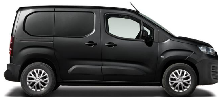
SVART, METALLIC (632)