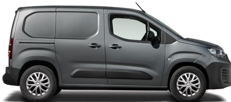
MÖRK GRÅ METALLIC (113)