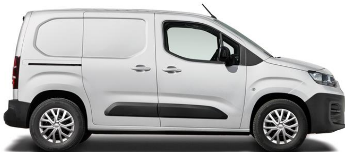
VIT, SOLID (549)