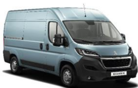
Blå Lago Azzuro (Metallic)