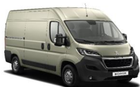
Grå Fer (Metallic)