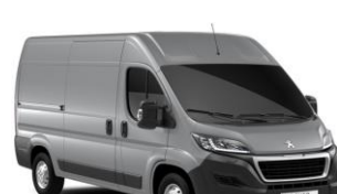
Grå Aluminium (Metallic)