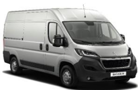
Grå Artense (Metallic)