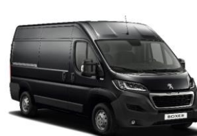
Grå Graphito (Metallic)